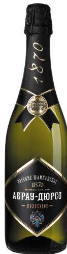
Abrau-Durso 俄羅斯氣泡酒， 半乾型