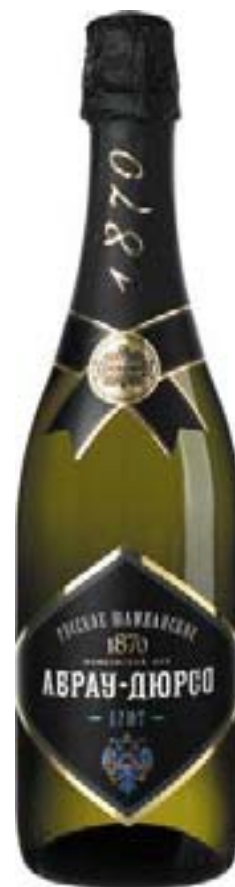
Abrau-Durso 俄羅斯氣泡酒， 乾型