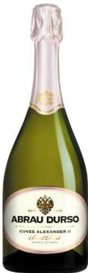
Abrau-Durso 精選特級亞歷山大二世， 粉紅乾型