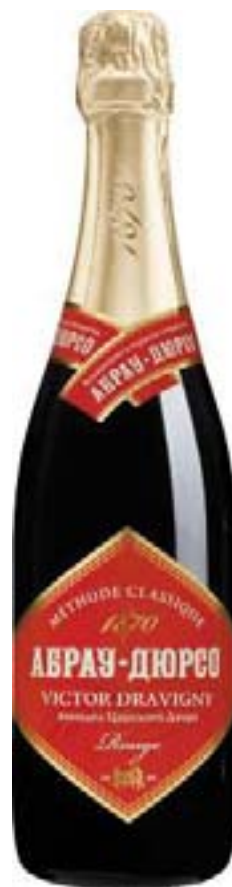
Abrau-Durso Premium Dravigny 獎品紅葡萄酒