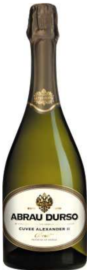
Abrau-Durso 精選特級亞歷山大二世， 乾型