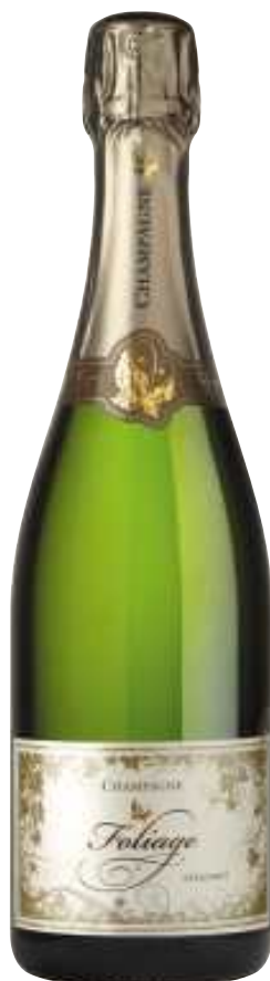
Foliage 气泡酒， 特別低甜度