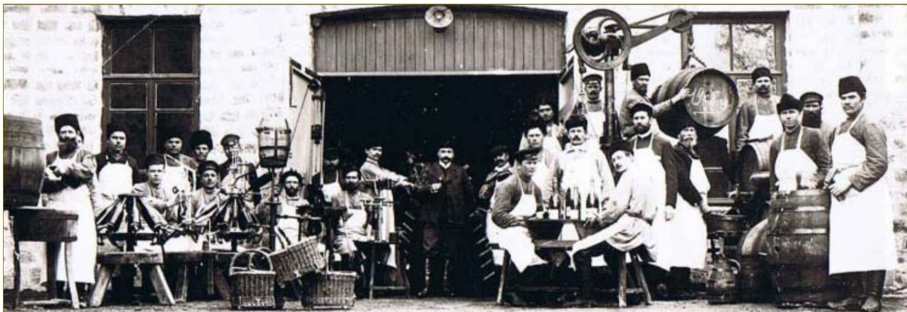
Иллюстрация из книги воспоминаний Робера Дравиньи:

«От этой фотографии нас отделяет целый век. Мой дед был бы восхищен, узнав, что дело, начатое им, имеет такое продолжение. Что касается меня, то я увидел подвалы, техническому оснащению которых могли бы позавидовать многие французские виноделы. Наши слова восхищения такой великолепной реализации проекта, который позволяет всему краю получить завидное качество жизни. Мои поздравления!»