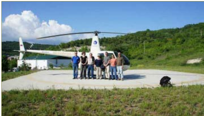
А так его потомки облетали Абрау-Дюрсо сто лет спустя.