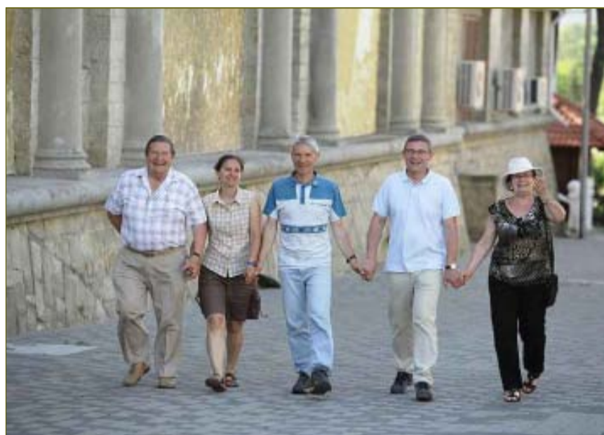
Первые шаги по дороге к заводу, который был построен при их деде.

Иллюстрация из книги воспоминаний Робера Дравиньи: