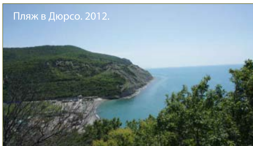
Пляж в Дюрсо. 2012.

«Этот пляж не имел ничего общего со знакомыми нам пляжами во Франции. Это было равнинное место, окруженное горами, покрытое крупной галькой и практически дикое. Только где-то на краю пляжа располагалось маленькое пристанище турецких рыбаков. Дни, проводимые в Дюрсо, были для нас наполнены радостью и счастьем. Маленькая речушка Дюрсо в этом месте впадала в море, и мы пускали по ней кораблики. Поскольку пляж был ровным, может быть, только с небольшим наклоном, мы могли забавляться в море столько, сколько хотели, без какого бы то ни было риска».