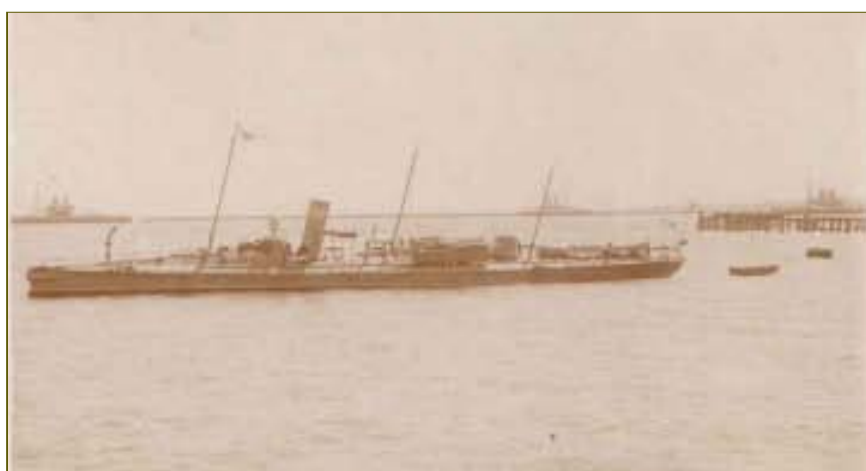
Эта фотография из Новороссийска хранится в семейном альбоме Дравиньи. Она была сделана 100 лет назад.