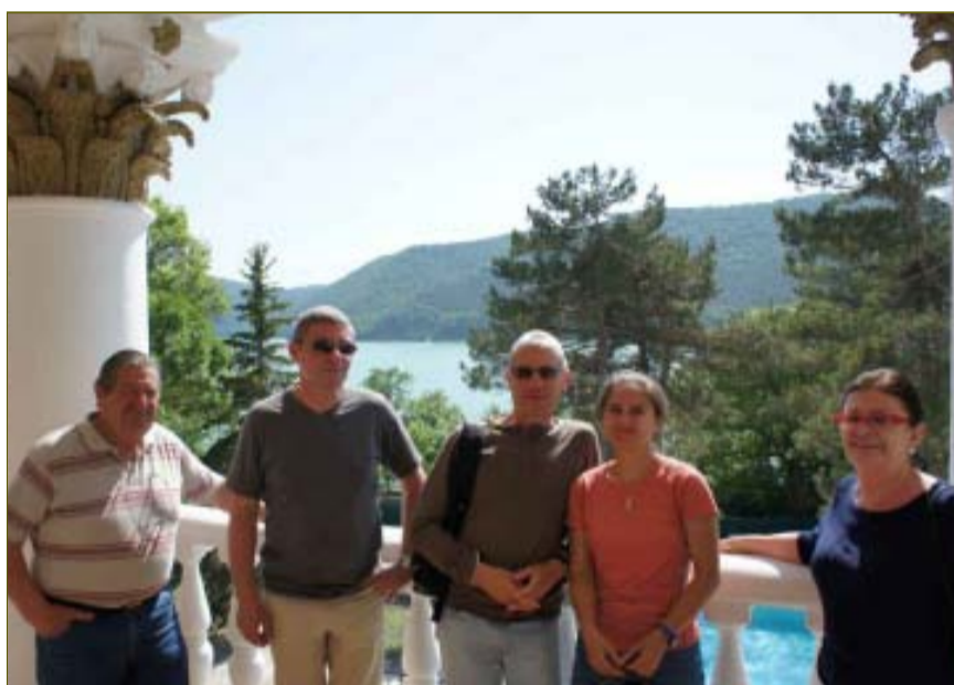
Утро на балконе с балкона ресторана гостиницы «Империял».

До последнего времени они знали об Абрау-Дюрсо только из книги воспоминаний «Россия моего детства. 1906-1919 гг.» сына Виктора Дравиньи, Робера. Теперь у них появилась возможность сравнить эти мемуары с реальностью. Об этом мы Вам и расскажем в нашем фотоотчёте.